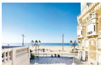
LES SABLES D'OLONNE, PLACE MARECHAL