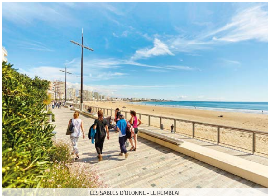
LES SABLES D'OLONNE - LE REMBLAI