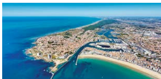
PANORAMA D'OLONNE-SUR-MER ET DES SABLES D'OLONNE

La Vendée : 2 ème département le plus visité de France