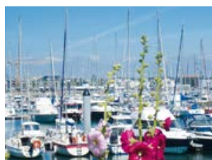
PORT DE PLAISANCE, LES SABLES-D'OLONNE