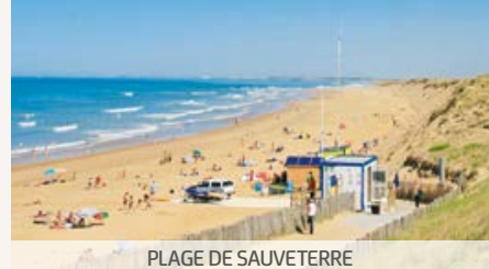
PLAGE DE SAUVETERRE