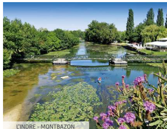
L'INDRE - MONTBAZON