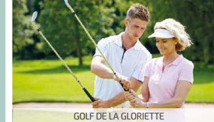
GOLF DE LA GLORIETTE