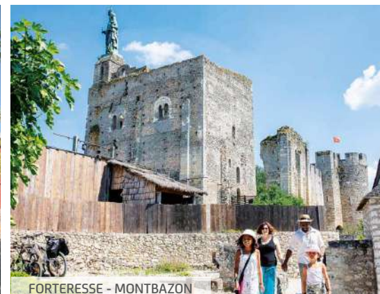
FORTERESSE - MONTBAZON