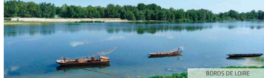
BORDS DE LOIRE