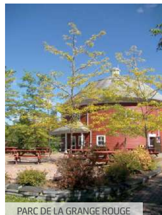
PARC DE LA GRANGE ROUGE