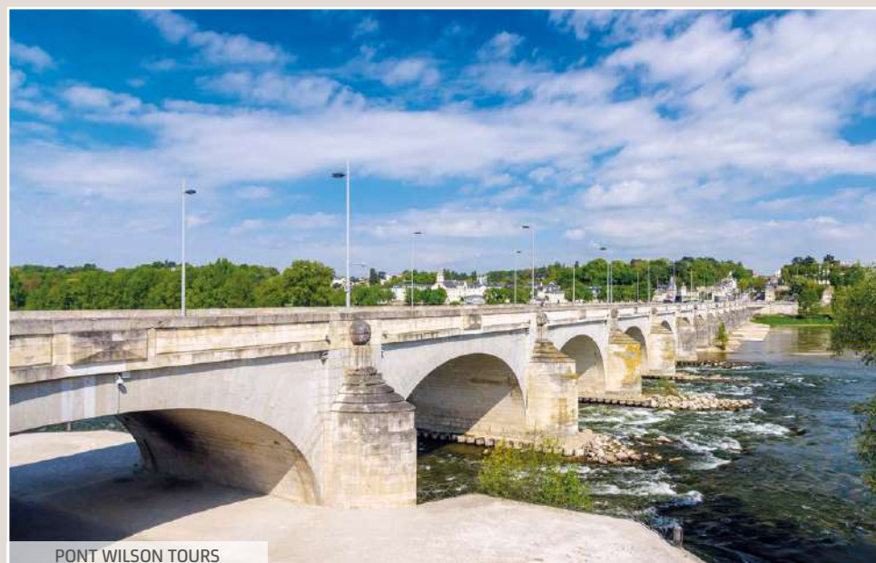
PONT WILSON TOURS