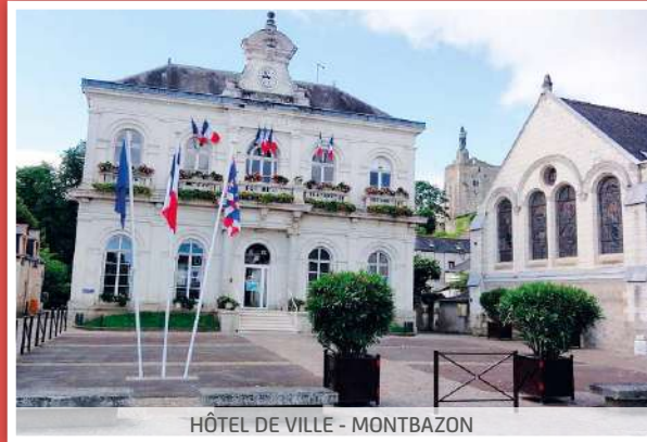
HÔTEL DE VILLE - MONTBAZON

SITUÉE À QUELQUES KILOMÈTRES DE TOURS, LA RÉSIDENCE DES "JARDINS MÉDICIS" VOUS RÉVÈLE LE CHARME D'UN CADRE AUTHENTIQUE TOURNÉ VERS LA NATURE