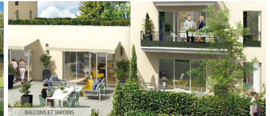
BALCONS ET JARDINS