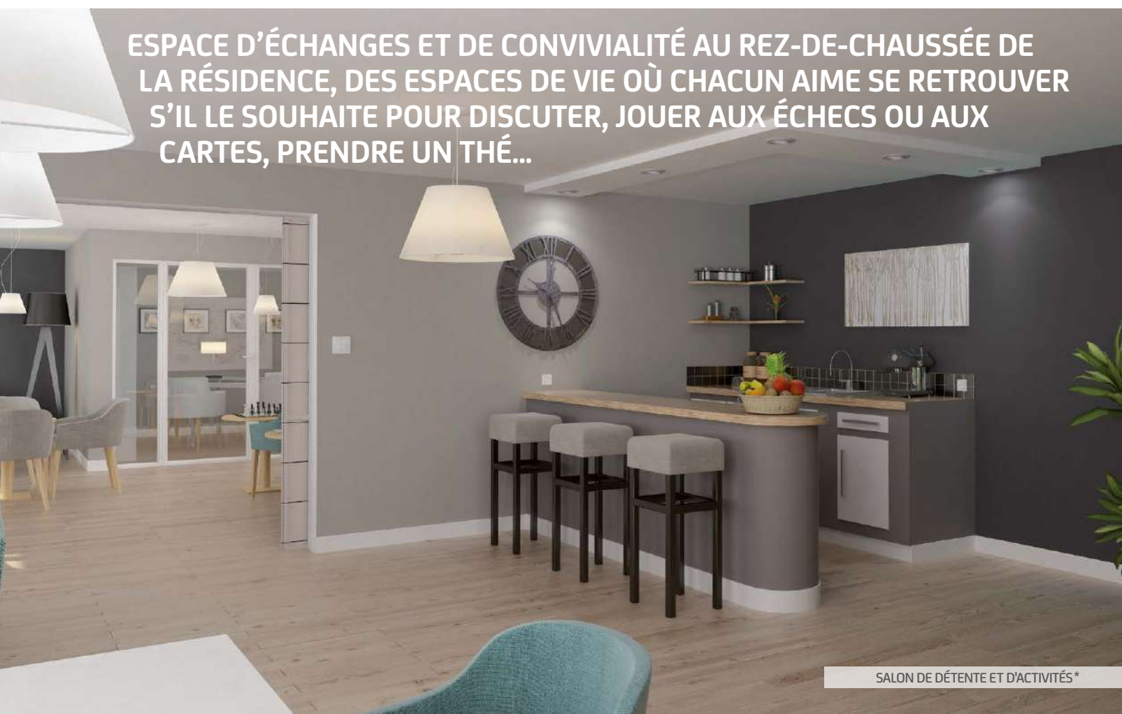
SALON DE DÉTENTE ET D'ACTIVITÉS*