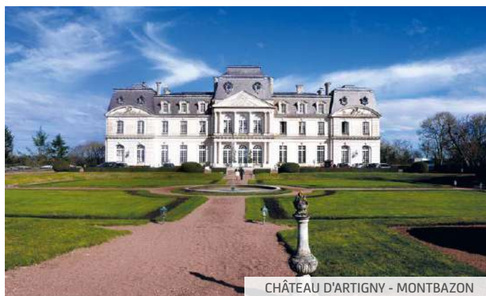
CHÂTEAU D'ARTIGNY - MONTBAZON

À moins de 250 km de Paris et en périphérie immédiate de la métropole Tourangelle, le territoire est accessible par de nombreuses liaisons autoroutières, ferroviaires et aériennes. Son dynamisme économique et ses multiples atouts ont convaincu Général Foy Investissement d'y implanter les "Jardins Médicis" pour offrir aux futurs acquéreurs le meilleur d'une vie de qualité.